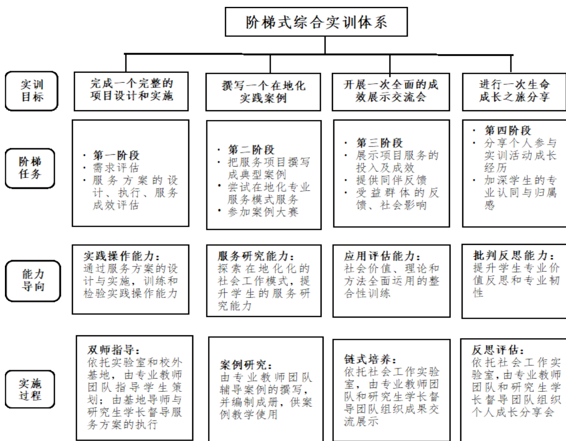
图 1：阶梯式综合实训-循证体系

《高级社会工作实务研究》等系列实务课从培养研究生的专业认知力和服务力，向构建学生的专业核心竞争力发展。阶梯式课程内容设置体现阶梯性、层级性和连续性，并且在难度、深度、广度三方面与关联课程区分，案例教学和服务项目策划得到高效应用，使研究生的专业学习形成“理论-实践-理论”的循证体系。改革后的实训课程体系见图 1：